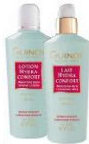
Hydra Confort Tej és Hydra Confort Tonik