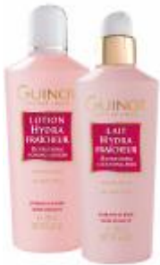
Hydra Fraicheur Tej és Hydra Fraicheur Tonik