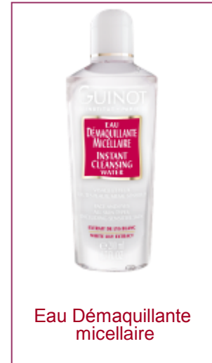
Eau Démaquillante micellaire

(Az Eau Demaquillante Parfait termék helyett)