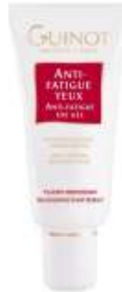
Anti -Fatigue Szemgél