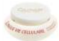
Longue Vie Cellulaire