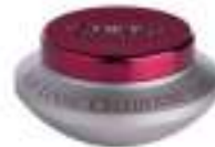
Age Logic Cellulaire